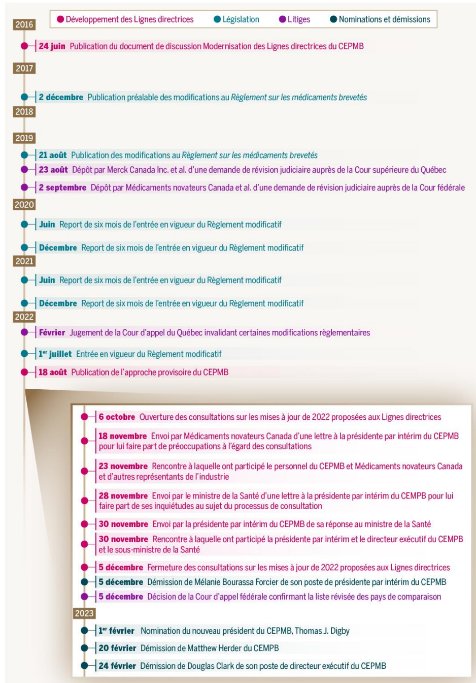
Figure 2 — Chronologie des réformes du CEPMB (événements clés)